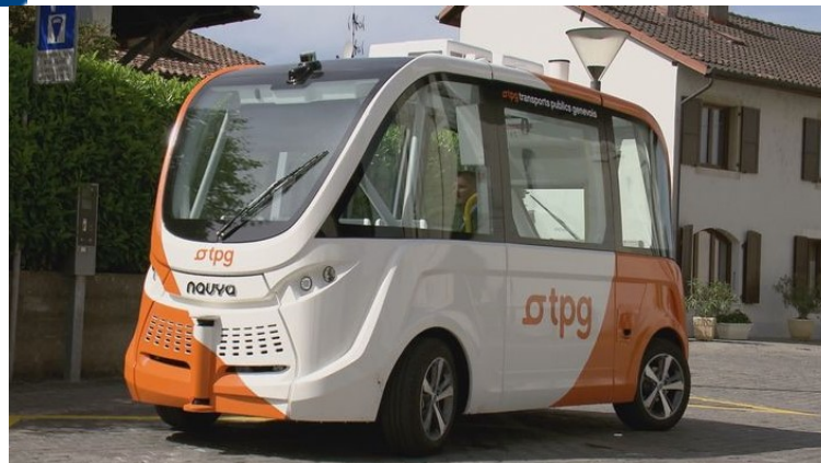
@ t p g . c h